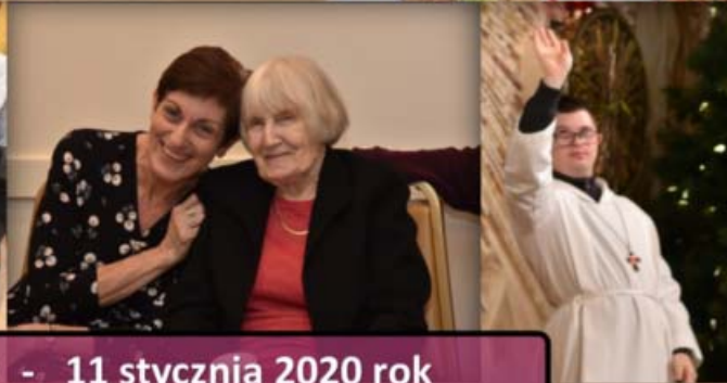
Jezuicki Ośrodek Milenijny - 11 stycznia 2020 rok