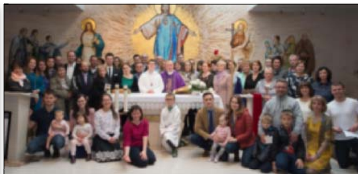
Duchowa Adopcja Dziecka Poczętego - 24 marca 2019

Wspólnota Życia Chrześcijańskiego, dziękuje wszystkim, którzy 24 marca tego roku złożyli przyrzeczenie Duchowej Adopcji Dziecka Poczętego. Modlitwę zakończyliśmy w środę, 25 grudnia. Niech Pan Bóg błogosławi nowonarodzonym dzieciom, ich rodzinom i Wam. Zapraszamy do rozpoczęcia kolejnej modlitwy, 22 marca 2020 roku.